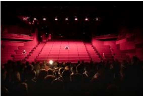
@ Vincent Beaume

→ Tarif unique collégien : 5€/élève → PASS'Collégien : 4€/élève Dès 14 ans